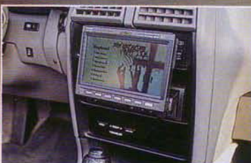
Mit Remote Control ausfahrbar: LCD-Display für DVD und Navigation