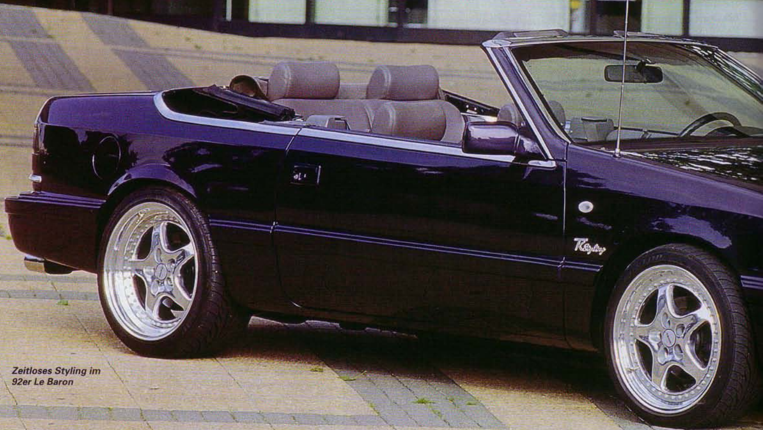
Zeitloses Styling im 92er Le Baron