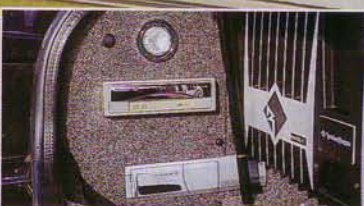
CD-Changer und DVD-Player haben ihre eigene Ecke im Kofferraum