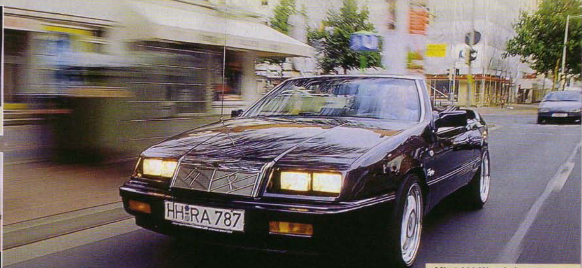
Mit 4.800 Watt Leistung kann man es im Cabrio ordentlich krachen lassen