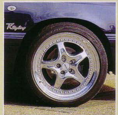
Sonderanfertigung: 18" Speedlines