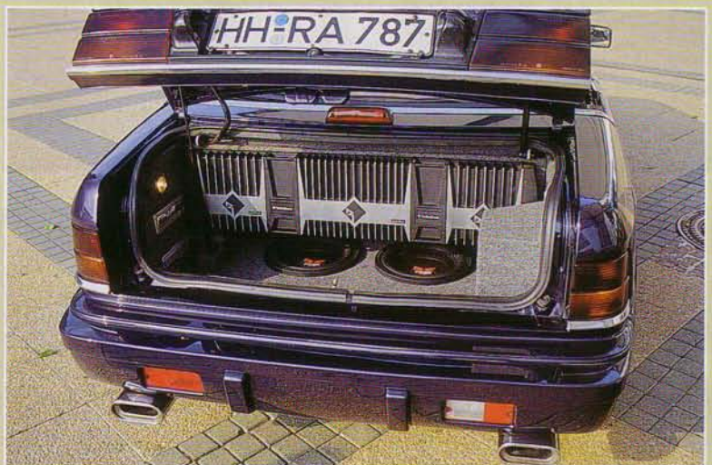
"Agent Orange"-Ersatz: "Superpunch" holt die Blätter von den Bäumen

Angefangen hatte der Schrauber seinerzeit mit 215er Pellen, die ihm aber nicht breit genug waren. Und so wagte er sich Schritt für Schritt weiter. Die nächste Stufe waren 225er, gefolgt von 255ern - und aktuell befinden sich 275er Dunlops